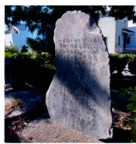
①堀川改修堤防築造碑

の「家藤沢館第6展示室」に詳しく述べられているので、関心のある方はネットで検索してみてください。