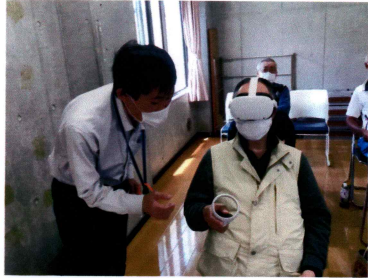
ゴーグルをつけてVR体験

5月17日(水)に町内会館1階にて、藤沢警察署生活安全課の職員を講師にお招きして、防災についてお話しをして頂きました。また、防犯交通安全課と鵜沼市民センターから市職員の方々もご参加頂きました。平日の午前中にもかかわらず、20人余りの参加者が集まり、職員との質疑応答や詐欺被害の体験談を